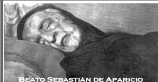
BEATO SEBASTIÁN DE APARICIO

Señor y Padre Nuestro: Derrama tu Santo Espíritu sobre estos hermanos nuestros, para que el calor de su amor sanador penetre en lo más íntimo de sus corazones. "Todo lo puedo en aquel que me conforta..."