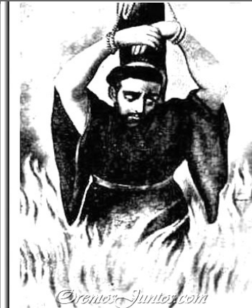
Beato Bartolomé Gutiérrez presbítero y mártir (1580-1632) de la Orden de San Agustín.

Interésate en la vida de los Santos. Esta semana busca la biografía o película Del Beato Bartolomé Gutiérrez, Presbítero y Mártir